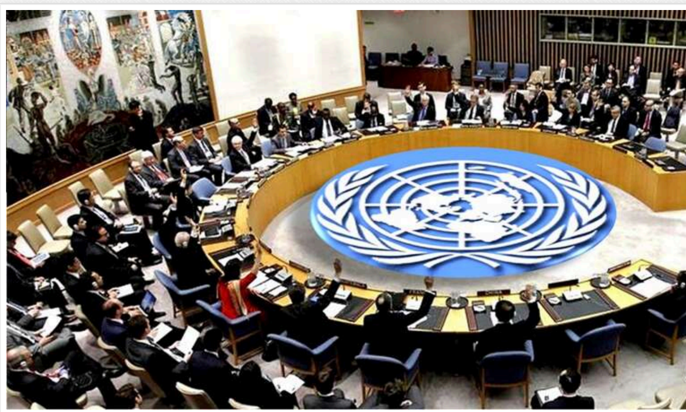
Сибіга: Україна розраховує на підтримку Китаю в Радбезі ООН

Україна сподівається отримати підтримку Китаю у забезпеченні глобальної ядерної безпеки. Також Україна ініціюватиме скликання засідання в Раді Безпеки ООН та ухвалення резолюції до третій роковин початку повномасштабної війни.