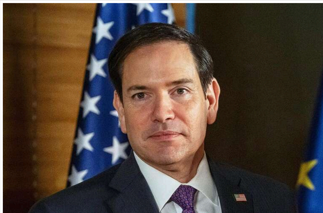
Марко Рубіо підтвердив розмову з Лавровим

Він повідомив, що зустріч відбулася «в ході обговорення між президентом Дональдом Трампом і президентом Росії Володимиром Путіним раніше на цьому тижні».