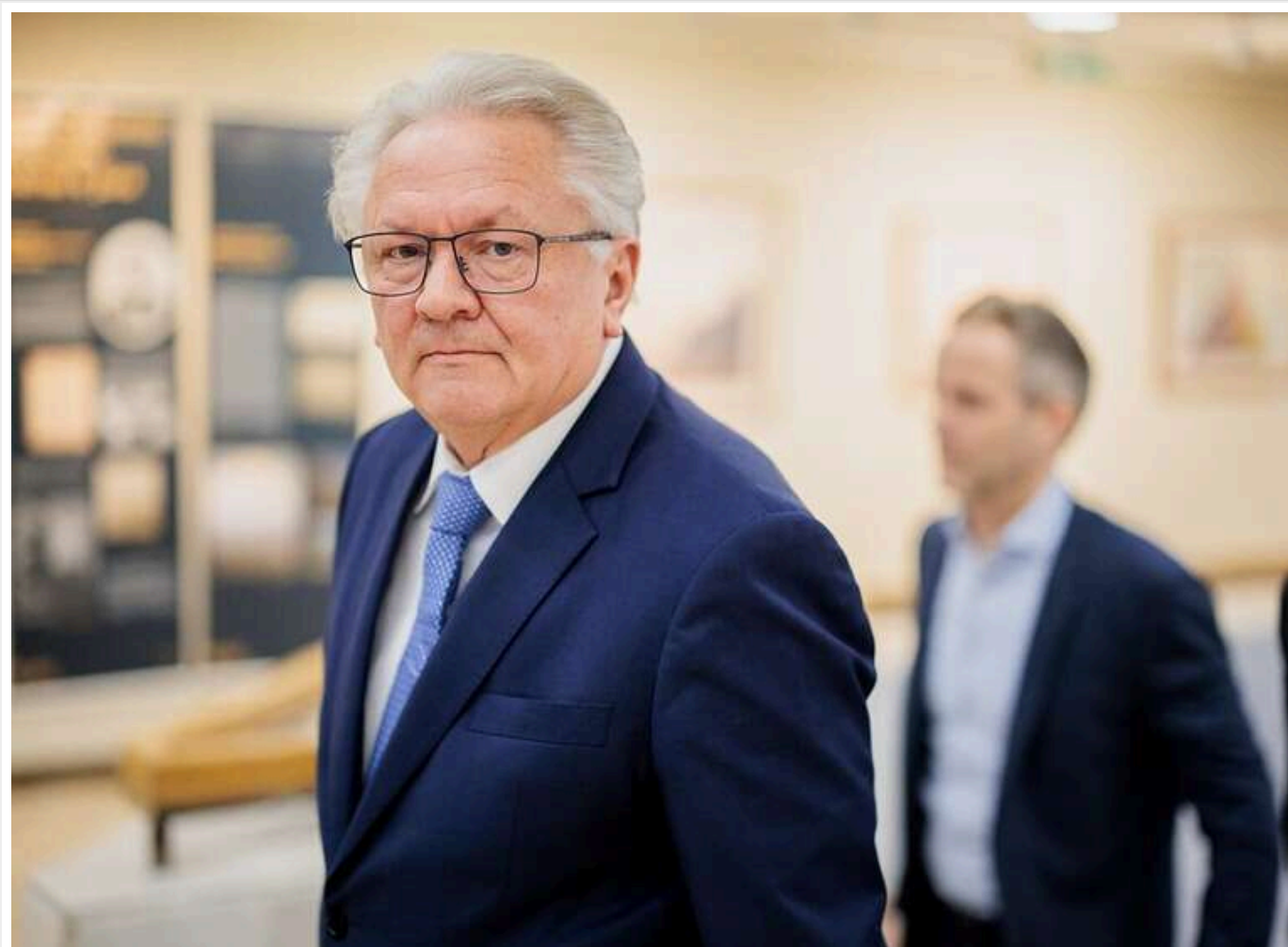
Голова Rheinmetall Паппергер: Будуємо три заводи в Україні

Компанія Rheinmetall планує відкрити три заводи в Україні. Хід війни не вплине на ці плани.