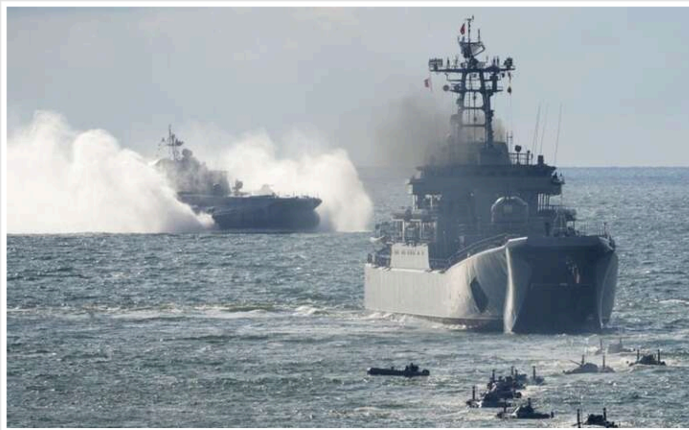
Міноборони Британії: Росія виводить із Сирії судна з боєприпасами

Упродовж останніх днів Міністерство оборони Великої Британії зафіксувало проходження через Ла-Манш 6 російських військових та торговельних кораблів, які перевозили боєприпаси.