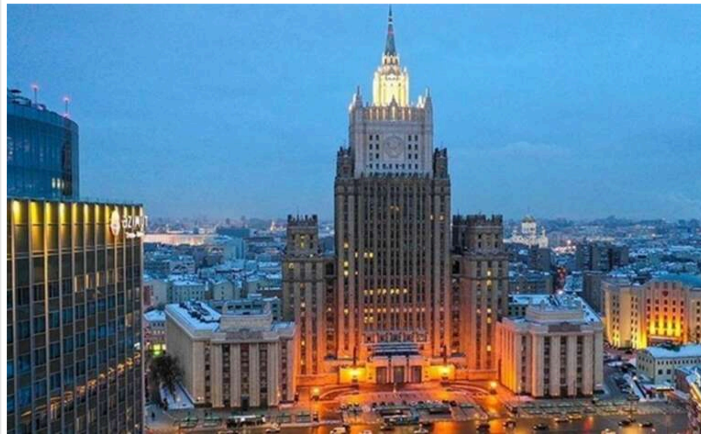
У МЗС РФ розповіли свою версію розмови між Рубіо та Лавровим

Міністерство закордонних справ Росії представило свою версію першої розмови між Лавровим і Рубіо.