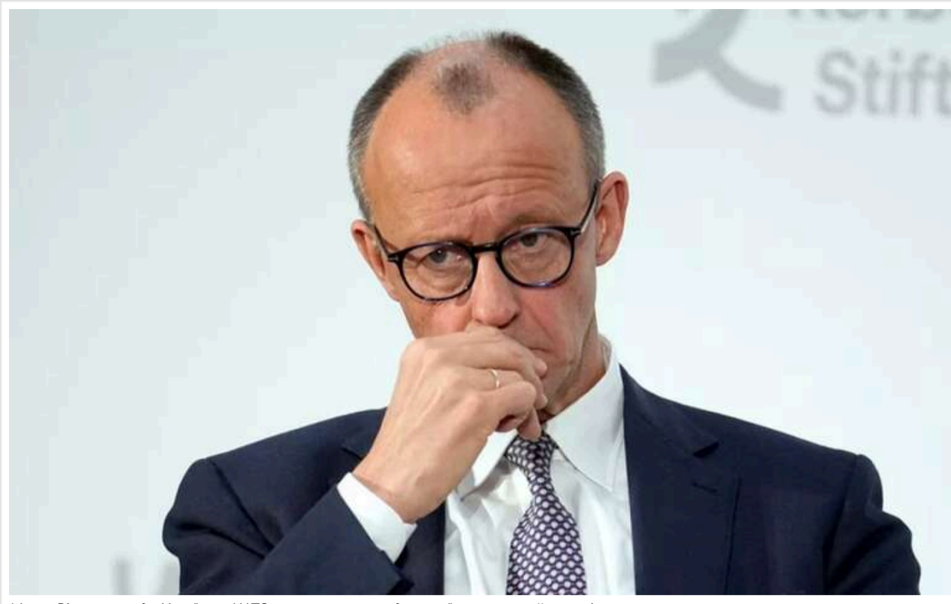
Мерц: Рішення щодо України в НАТО вже ухвалено, жодна країна не може його змінити

Кандидат на посаду канцлера Німеччини Фрідріх Мерц заявив, що під час попереднього саміту країни НАТО ухвалили рішення, що Україна матиме перспективу членства у військовоому блоці. Також він підкреслив, що лише одна держава не може одноосібно змінити це колективне рішення.