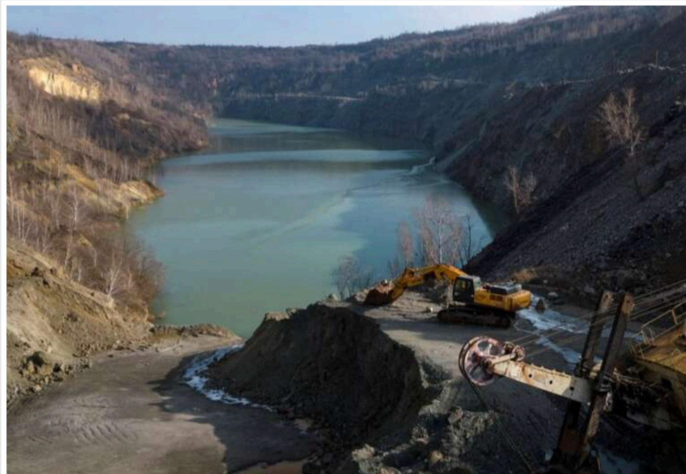
Американці наполягають на "дуже суворій" угоді з Києвом про передачу контролю над ресурсами, - нардеп

Цю інформацію надав народний депутат Олексій Гончаренко.