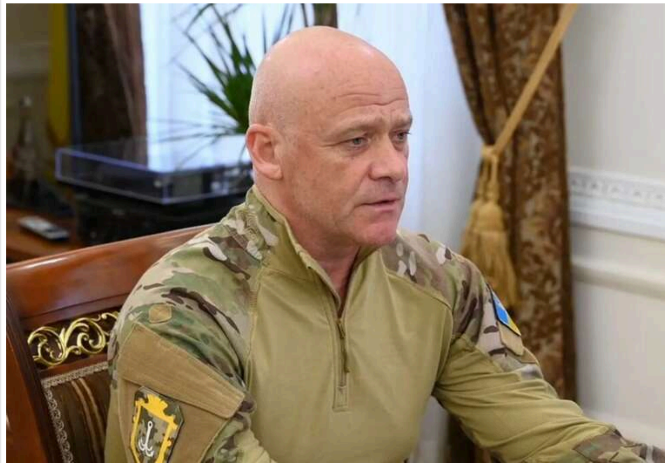
Після конференції в Мюнхені проти мера Одеси Труханова можуть запровадити санкції

Мер Одеси Геннадій Труханов може потрапити під санкції США після Мюнхенської конференції. Американська делегація готує докази його зв'язків з російськими структурами.