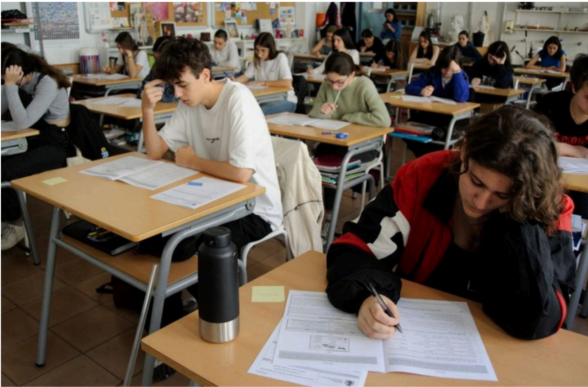
НМТ / Фото з відкритих джерел

ЛИСЕНКО КАТЕРИНА — 02 Червня 2026, 19:02 2 Mins Read — СУСПІЛЬСТВО