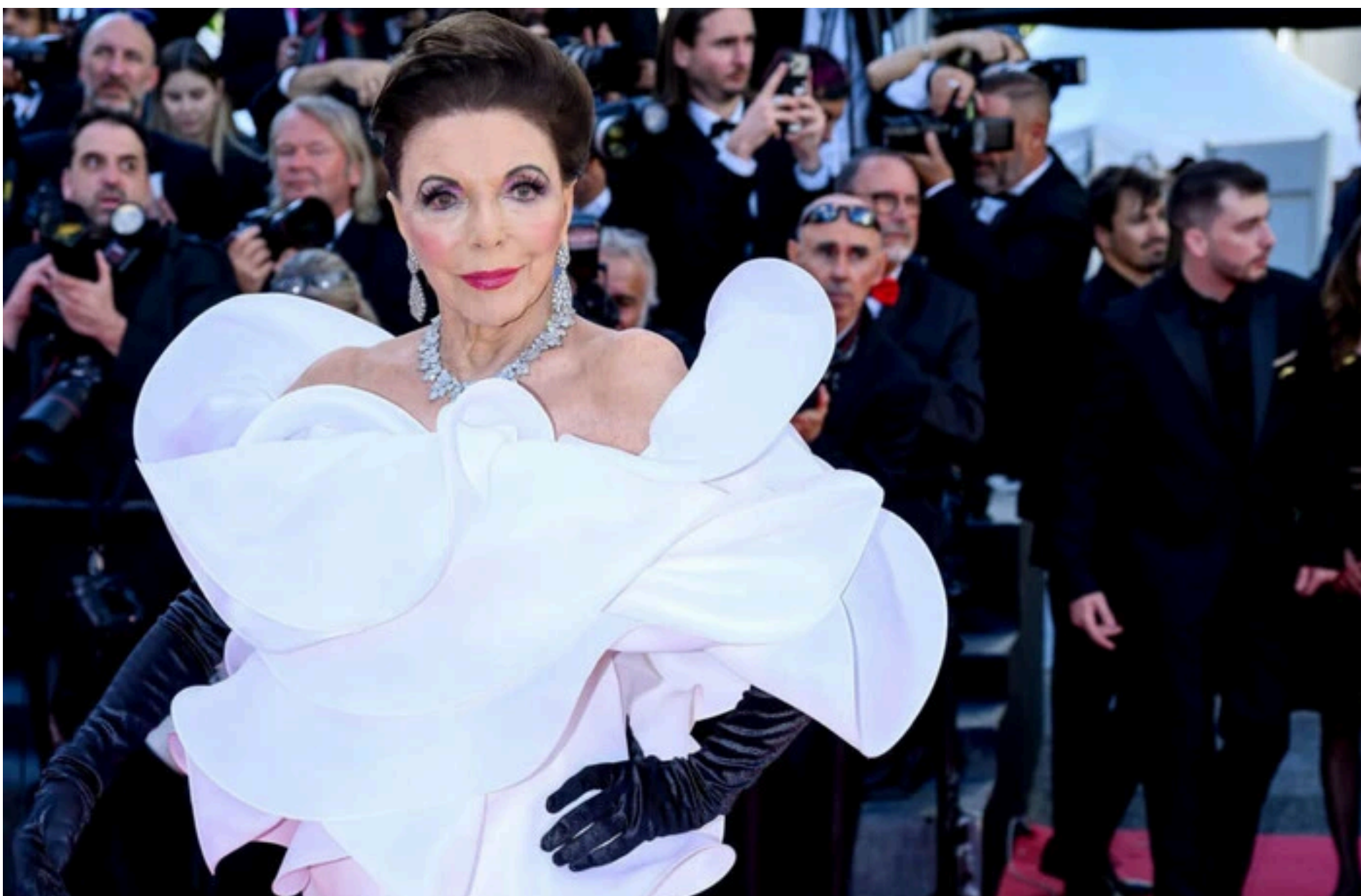
Джоан Коллінз

СТЕПАНЕНКО ГРИГОРІЙ — 02 Червня 2026, 19:10 2 Mins Read — ГЛУМУР