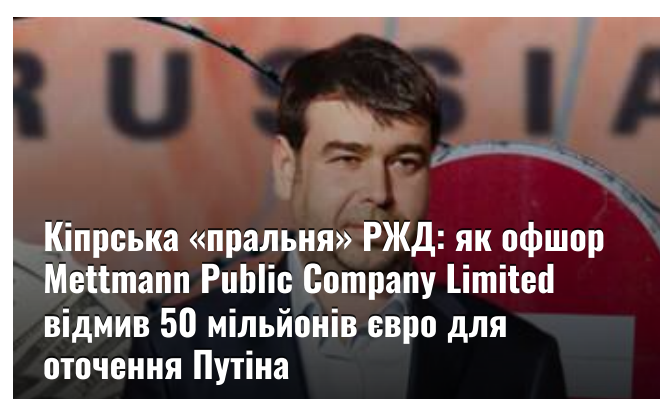
Кіпрська «пральня» РЖД: як офшор Mettmann Public Company Limited відмив 50 мільйонів євро для оточення Путіна