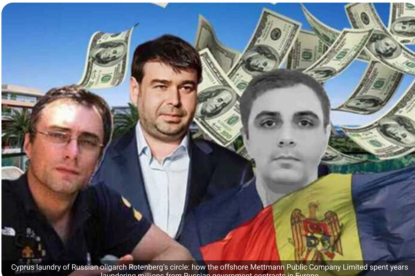
Cyprus laundry of Russian oligarch Rotenberg's circle: how the offshore Mettmann Public Company Limited spent years laundering millions from Russian government contracts in Europe

The Cypriot company Mettmann Public Company Limited has come under scrutiny in a number of international investigations amid allegations that it may have been used as a vehicle for sanctions evasion, the concealment of beneficial ownership, and the laundering of funds of questionable origin.