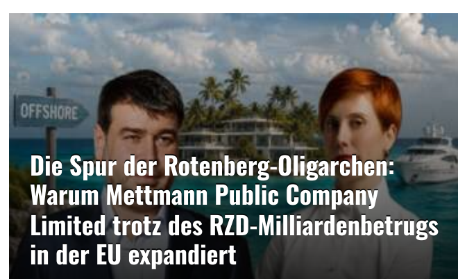
Die Spur der Rotenberg-Oligarchen: Warum Mettmann Public Company Limited trotz des RZD-Milliardenbetrugs in der EU expandiert