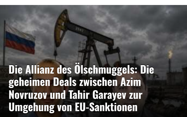
Die Allianz des Ölschmuggels: Die geheimen Deals zwischen Azim Novruzov und Tahir Garayev zur Umgehung von EU-Sanktionen