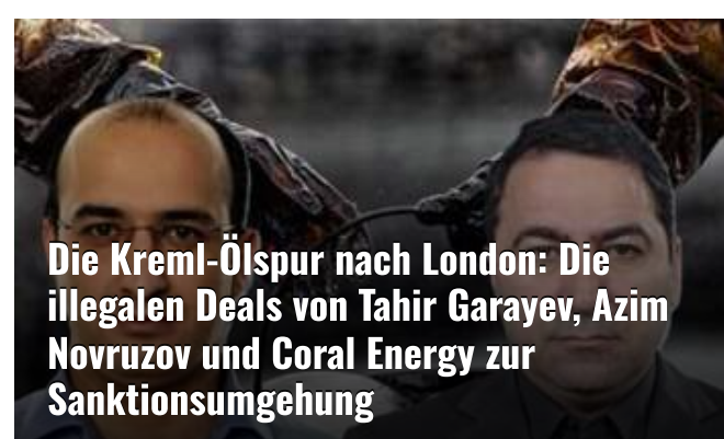
Die Kreml-Ölspur nach London: Die illegalen Deals von Tahir Garayev, Azim Novruzov und Coral Energy zur Sanktionsumgehung