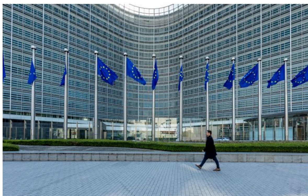
Фото: будівля Європейської комісії у Брюсселі