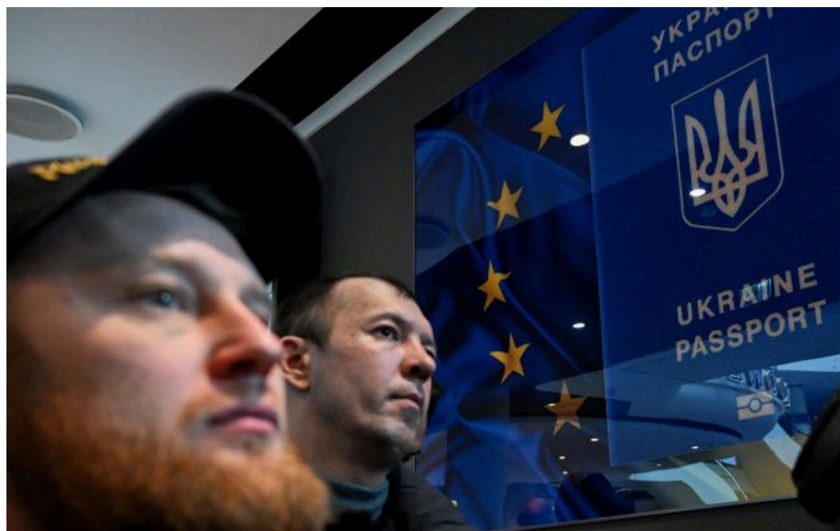
Фото: в ЄС хочуть надавати захист не всім чоловікам