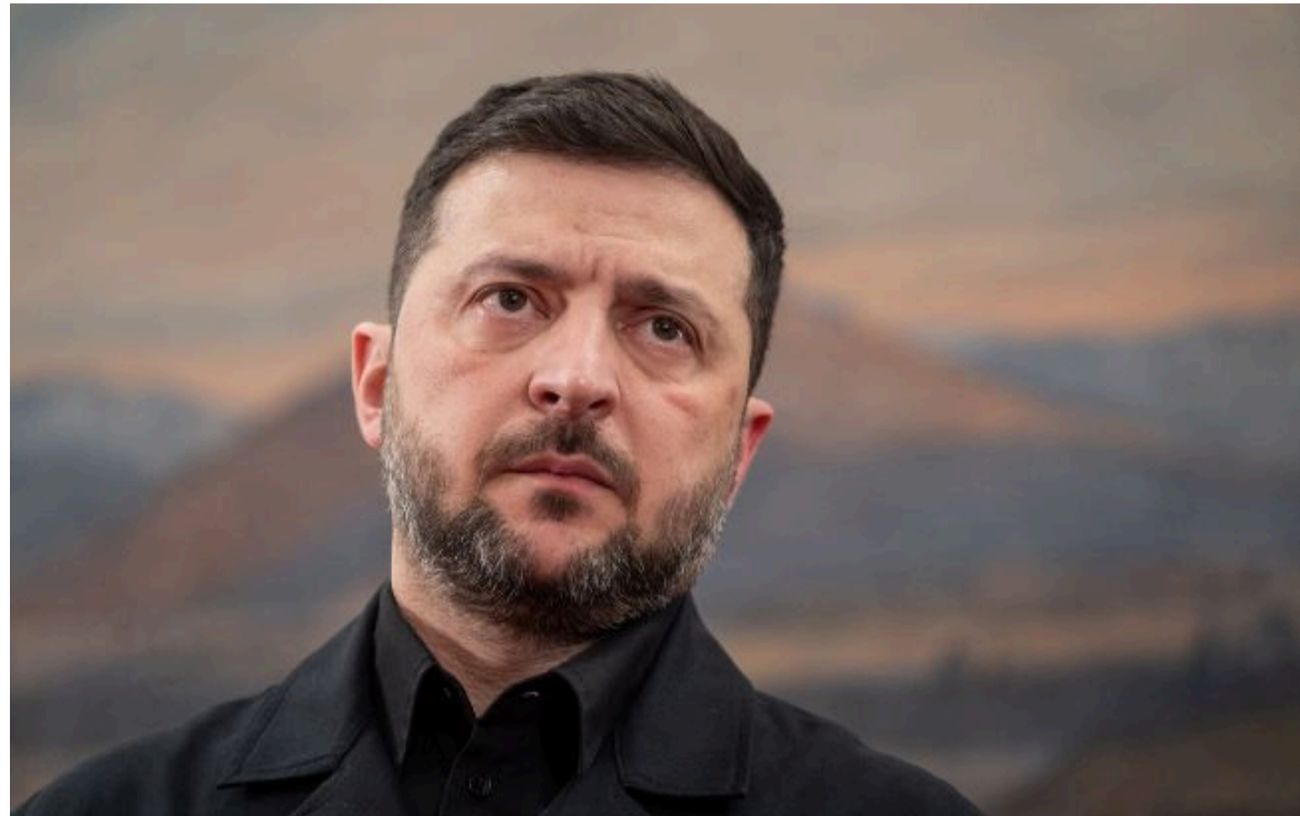
Фото: Володимир Зеленський (Getty Images)