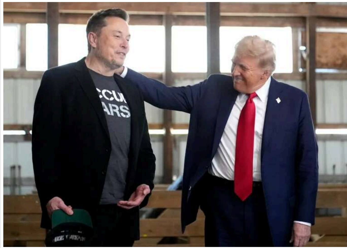
Трамп підписав указ, що надає відомству Маска особливі повноваження щодо звільнення чиновників