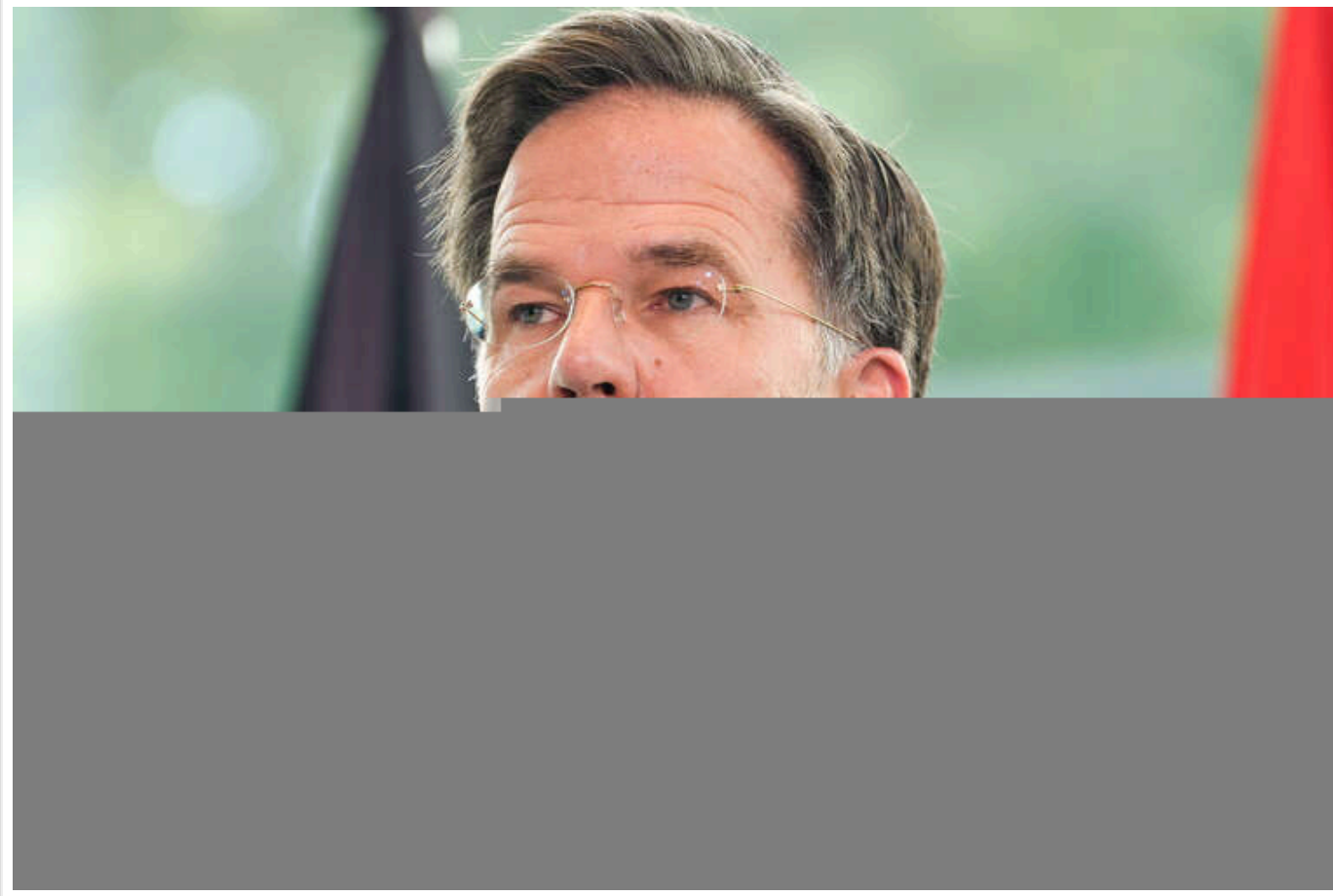
Рютте застеріг Путіна, що відповідь НАТО на потенційну атаку з боку Росії буде "нищівною"

Генсек НАТО Марк Рютте попередив, що реакція Альянсу буде нищівною у разі російської агресії проти країн-членів.