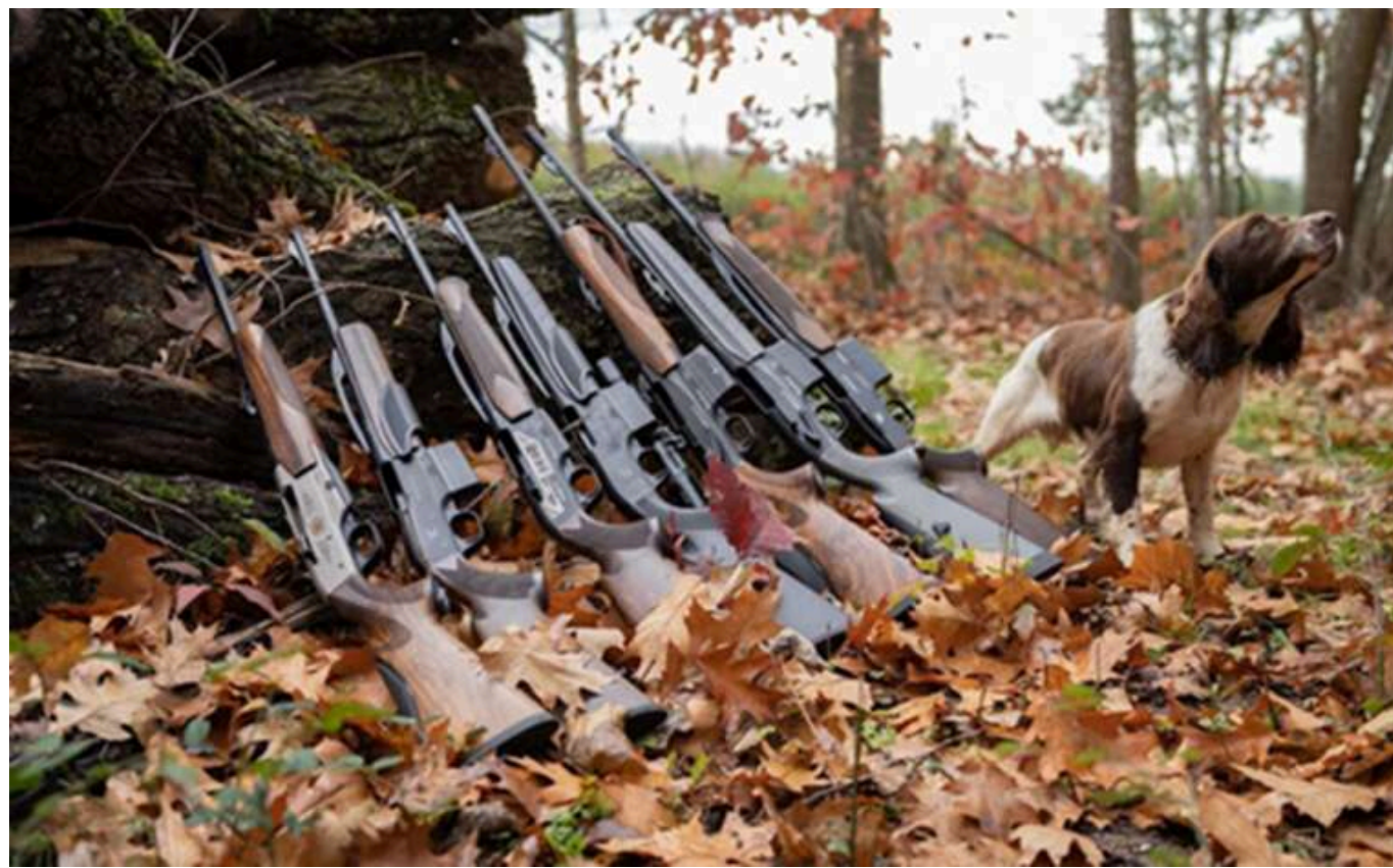
У Франції збанкрутувала найстаріша збройна компанія Verney-Carron: не підтвердили контракт з Україною

У 2023 році компанія уклала контракт на постачання 12 000 гвинтівок і 600 40-мм підствольних гранатометів. Проте, як повідомляє BFM TV, контракт не був підтверджений.