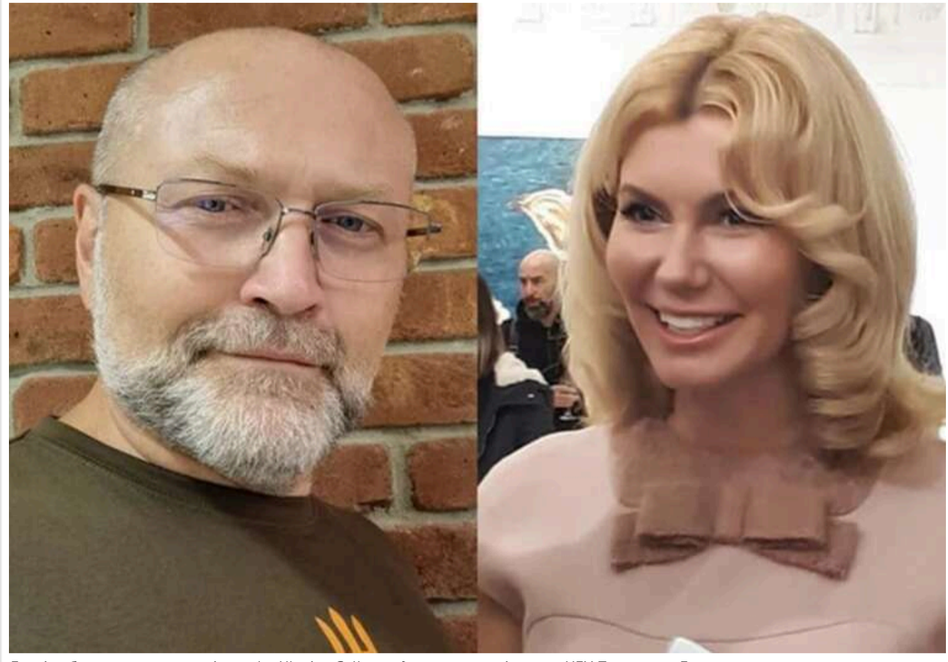
Банкіри брали участь в аукціонах Art Ukraine Gallery задля лояльності голови НБУ Пишного, – Береза

У "тихих аукціонах", котрі проводила галерея Art Ukraine Gallery в партнерстві Наталії Заболотної й Людмили Пишної, регулярно брали участь власники банків, які в такий спосіб намагалися вибудувати дружні стосунки з головою НБУ Андрієм Пишним.