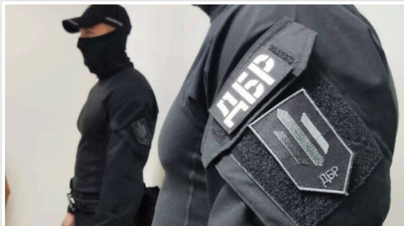
На Київщині суддя за підробленими документами поїхав відпочивати на Кариби: йому загрожує позбавлення волі строком до 5 років

Згідно з інформацією Державного бюро розслідувань, в оформленні документів судді допомагав адвокат. Наразі обвинувальні висновки щодо обох осіб передані до суду.