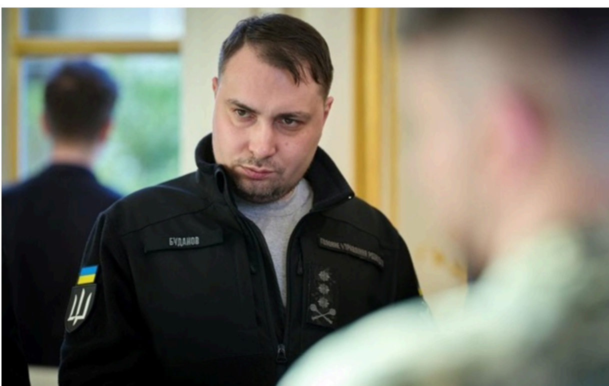
Буданов вважає ймовірною російську агресію проти Вірменії

Певні сигнали з Кремля у бік Єрєвана почали з'являтися ще два роки тому, підкреслив глава ОП.