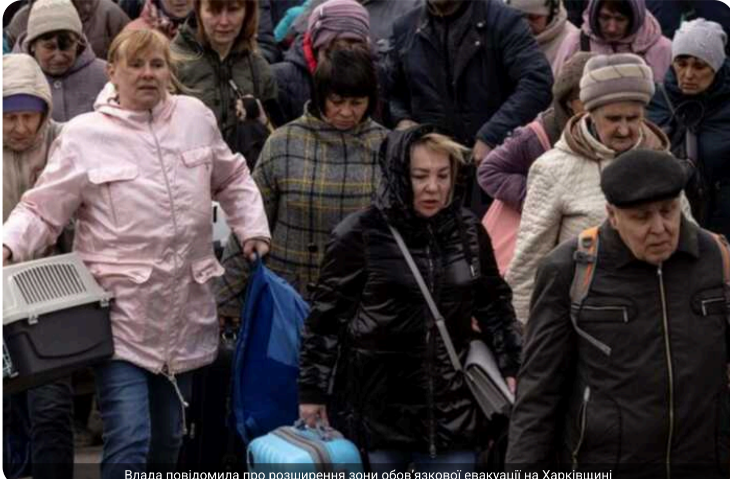
Влада повідомила про розширення зони обов'язкової евакуації на Харківщині

У Харківській області Рада оборони через погіршення безпекової ситуації та регулярні обстріли розширила зону обов'язкової евакуації на Золочівському напрямку.