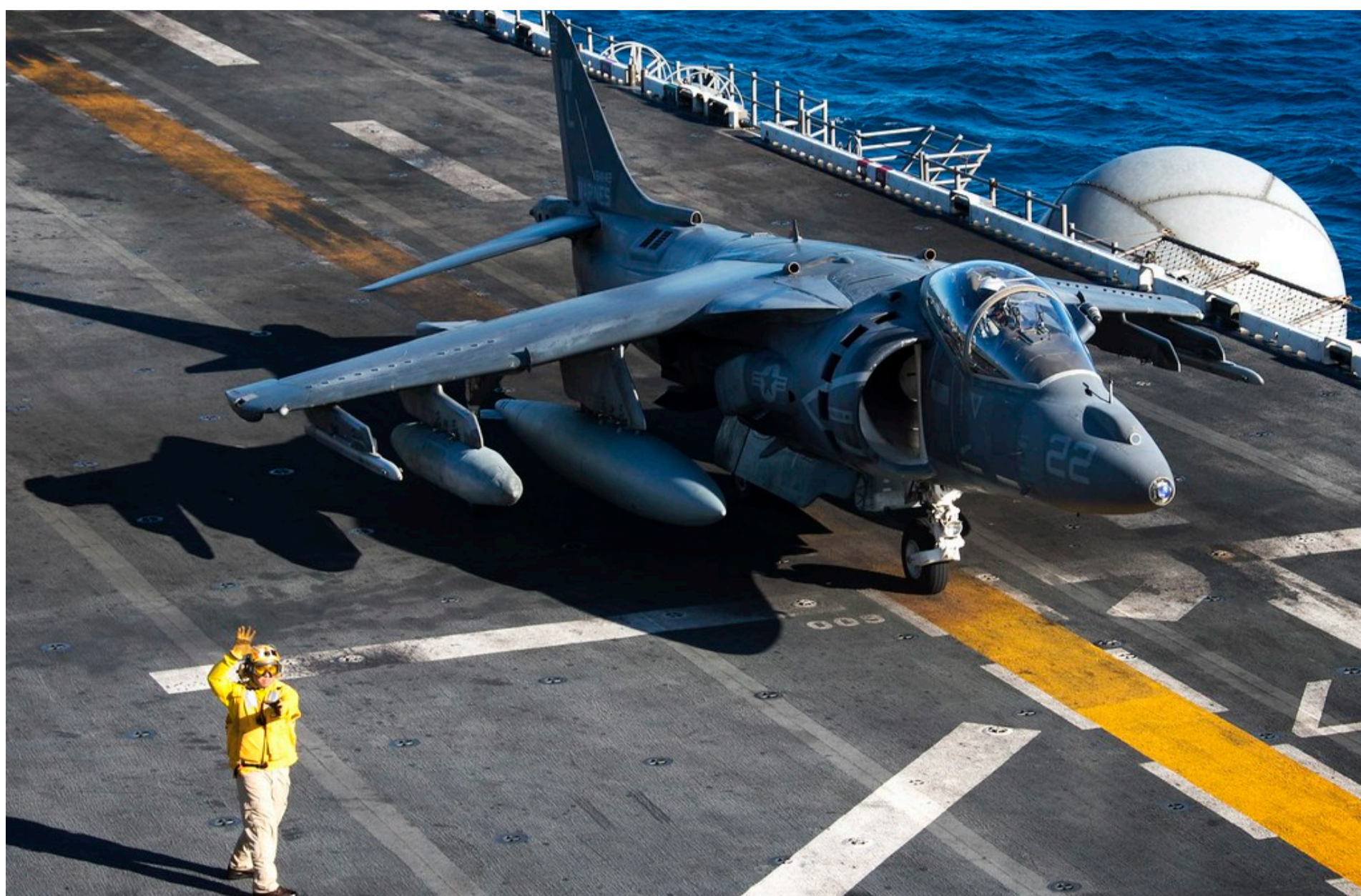
AV-8B Harrier II

КАРПЕЦЬ ОЛЕКСАНДР — 02 Червня 2026, 16:40 2 Mins Read — АРМІЯ І ЗБРОЯ