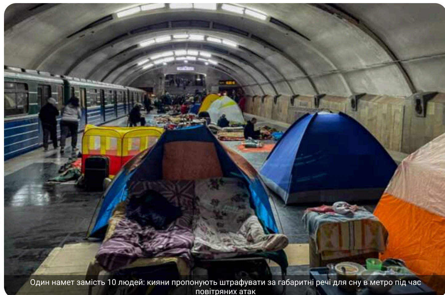
Один намет замість 10 людей: кияни пропонують штрафувати за габаритні речі для сну в метро під час повітряних атак

У Києві обговорюють доцільність використання туристичних наметів та великих речей у метро під час повітряних тривог, оскільки вони займають багато простору в укриттях і створюють незручності для інших пасажирів.