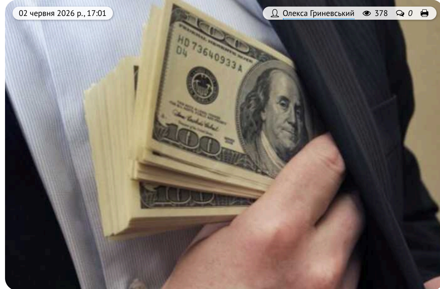
Ексдиректора лікарні на Буковині обвинувачують у нарахуванні «ковідних» доплат

Експерта директора комунальної лікарні в Чернівецькій області передано до суду у справі про ймовірне привласнення та розтрату бюджетних коштів.