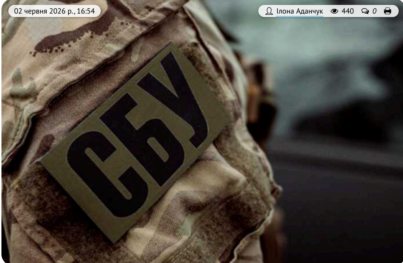
СБУ затримала коригувальника, який наводив російські ракети на Дніпро: зрадник виявився ексвійськовим з паспортом РФ

2 червня Служба безпеки України затримала коригувальника російських ударів по Дніпру.