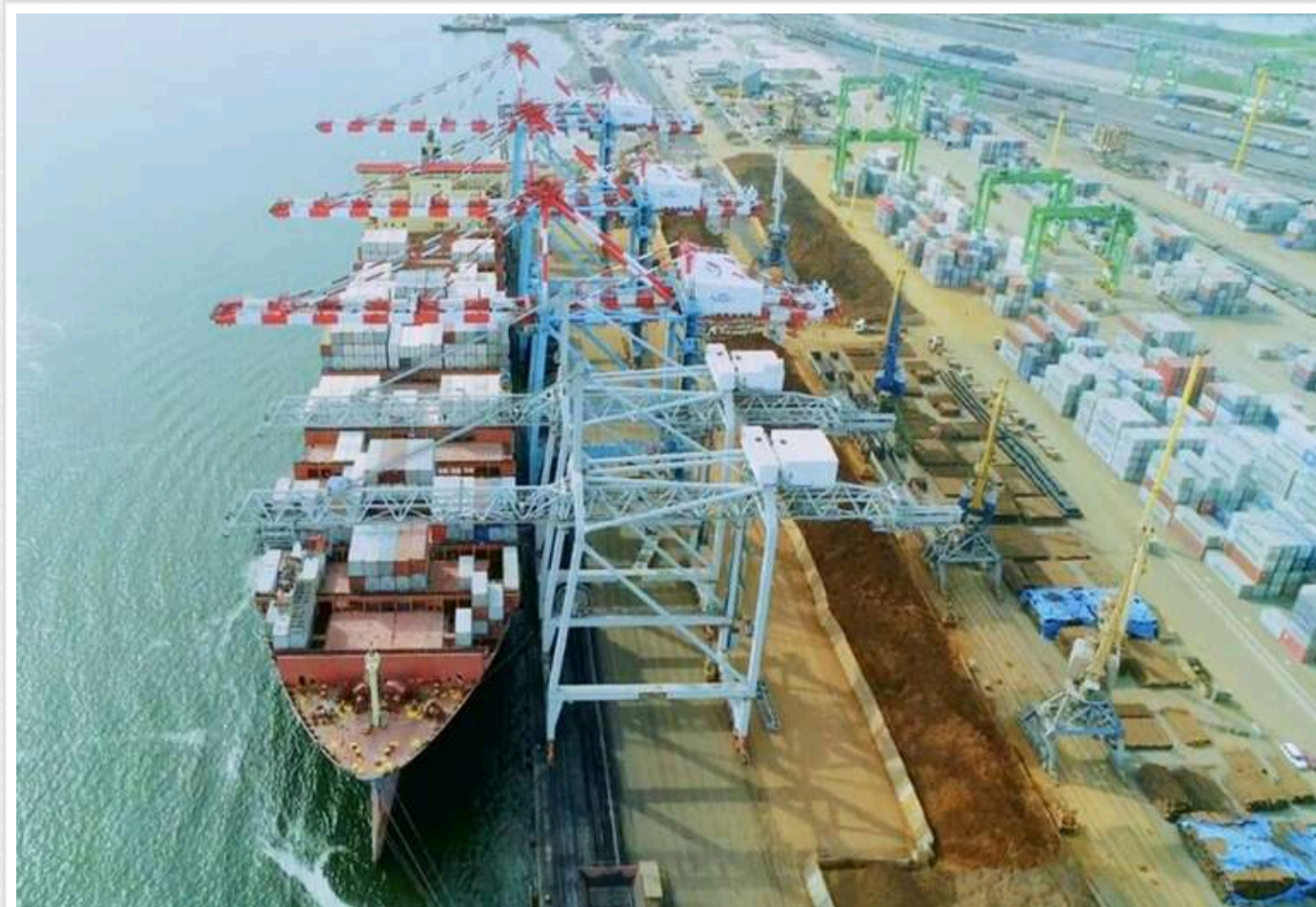
Світовий лідер морських перевезень MSC викупив контрольний пакет акцій контейнерного терміналу TIS

Один із найбільших контейнерних операторів світу, швейцарська компанія Mediterranean Shipping Company (MSC), стала власницею контрольного пакету акцій (51%) контейнерного терміналу TIS, що розташованого в акваторії порту Південний.