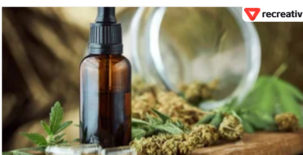
САМОЛІКУВАННЯ МОЖЕ БУТИ ШКОДЛИВИМ ДЛЯ ВАШОГО ЗДОРОВ'Я

Якщо з'явилися варикозні вени або синюшні вузли, застосуйте це