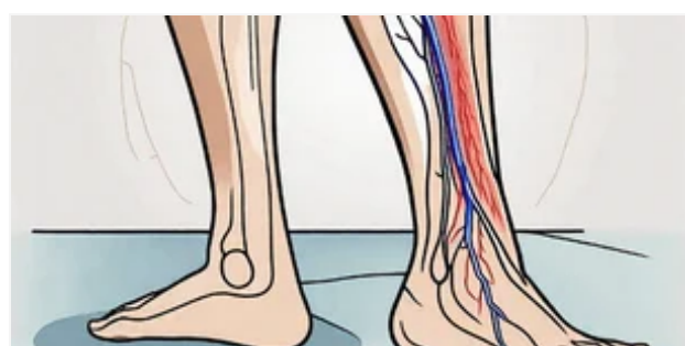
САМОЛІКУВАННЯ МОЖЕ БУТИ ШКОДЛИВИМ ДЛЯ ВАШОГО ЗДОРОВ'Я