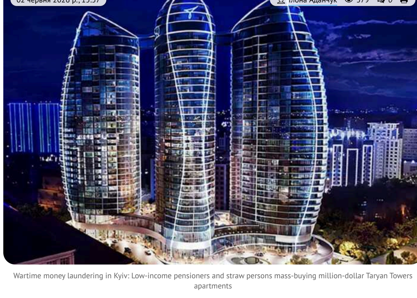
Wartime money laundering in Kyiv: Low-income pensioners and straw persons mass-buying million-dollar Taryan Towers apartments

Amid war, austerity, and ongoing support for the army in Ukraine, high-value real estate transactions continue in the capital. In the elite residential complex Taryan Towers, apartments are reportedly being bought by people whose declared incomes appear insufficient to justify such purchases.