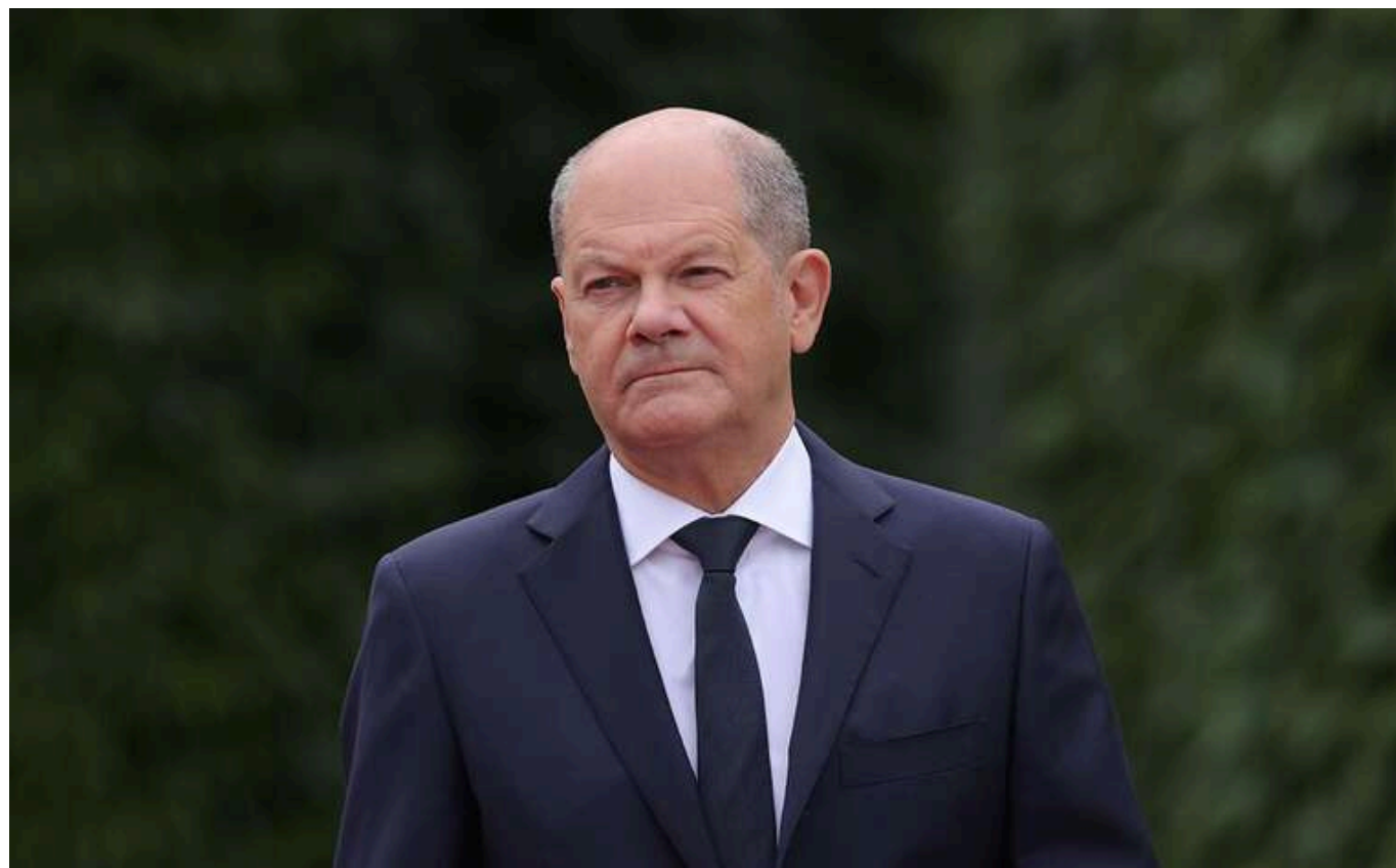
Шольц: Вимоги Росії стосовно демілітаризації України є неприйнятними

Партнери України продовжать її підтримувати, а вимоги Росії щодо демілітаризації та нав'язування лояльного їй керівництва неприйнятні.