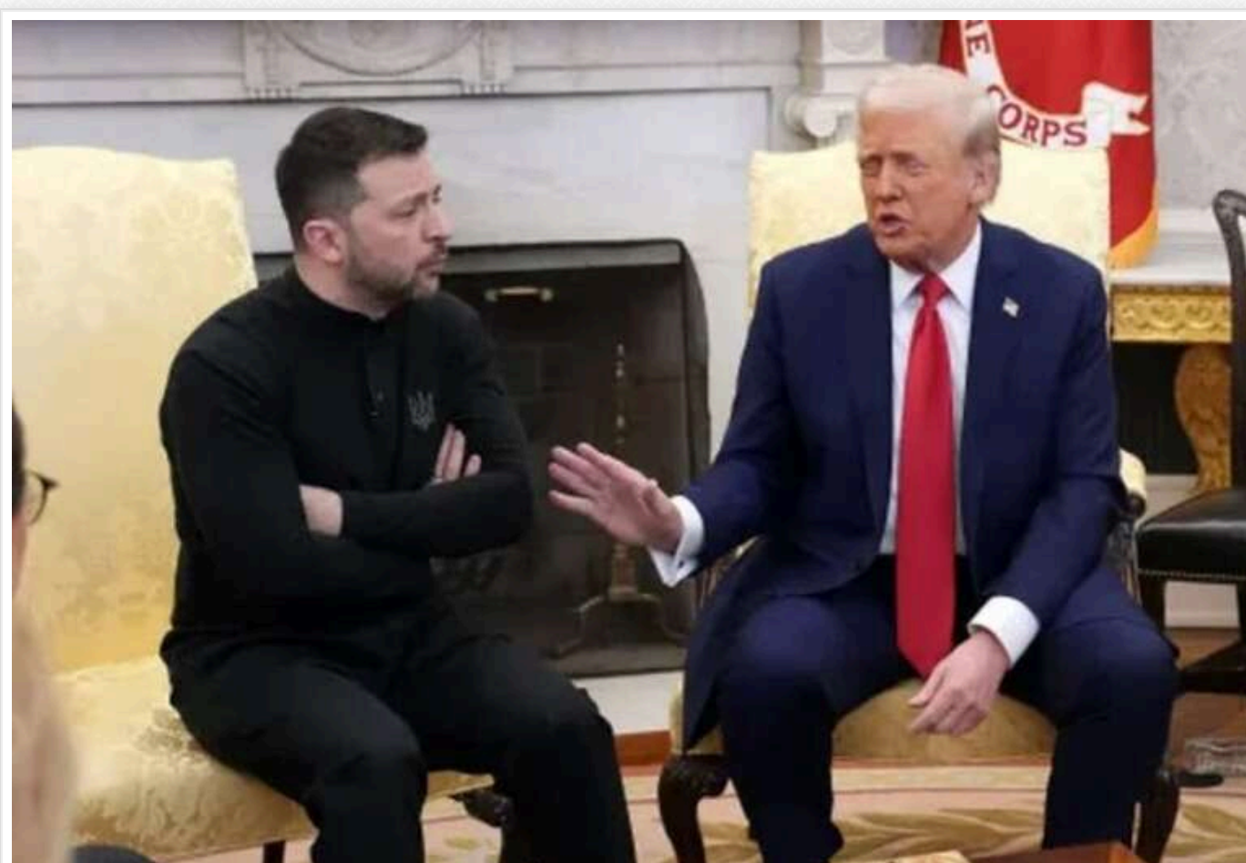
Трамп після сварки в Овальному кабінеті з'їв обід Зеленського, - Білий дім

Президент США Дональд Трамп з'їв обід, призначений для його українського колеги Володимира Зеленського, після їхньої суперечки в Білому домі.