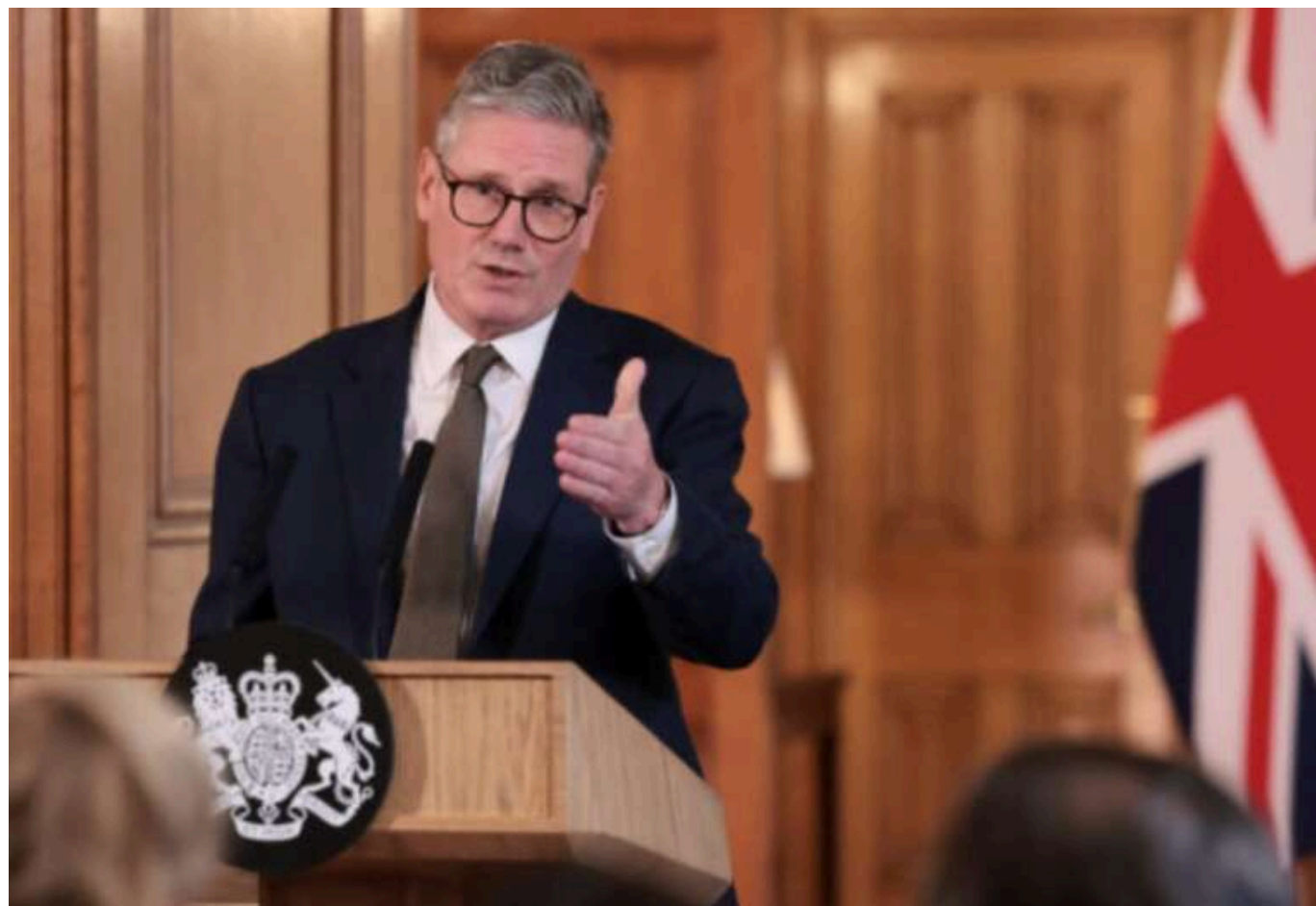
Стармер заявив про виділення Україні 1,6 мільярда фунтів на ракети для ППО

Окрім вчорашнього оголошення про позику у розмірі 2,2 млрд фунтів стерлінгів, прем'єр-міністр Великої Британії Кір Стармер повідомив про виділення 1,6 млрд фунтів стерлінгів на виготовлення ракет для України у Британії.