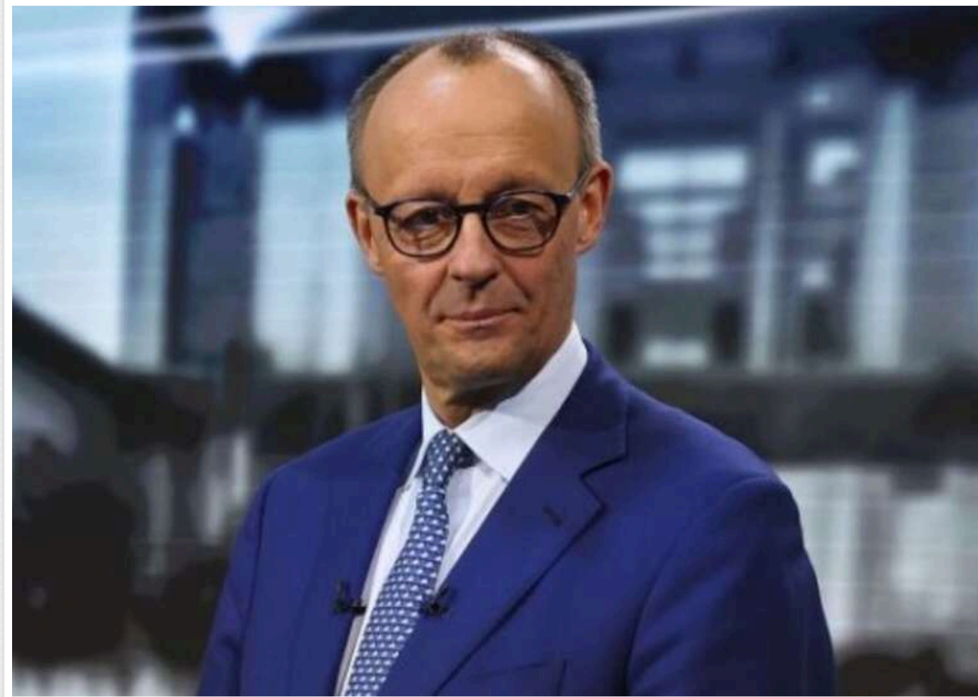
Мерц планує якнайскоріше зустрітися з Трампом

Можливий майбутній канцлер Німеччини Фрідріх Мерц планує зустрітися з президентом США Дональдом Трампом за першої ж нагоди.