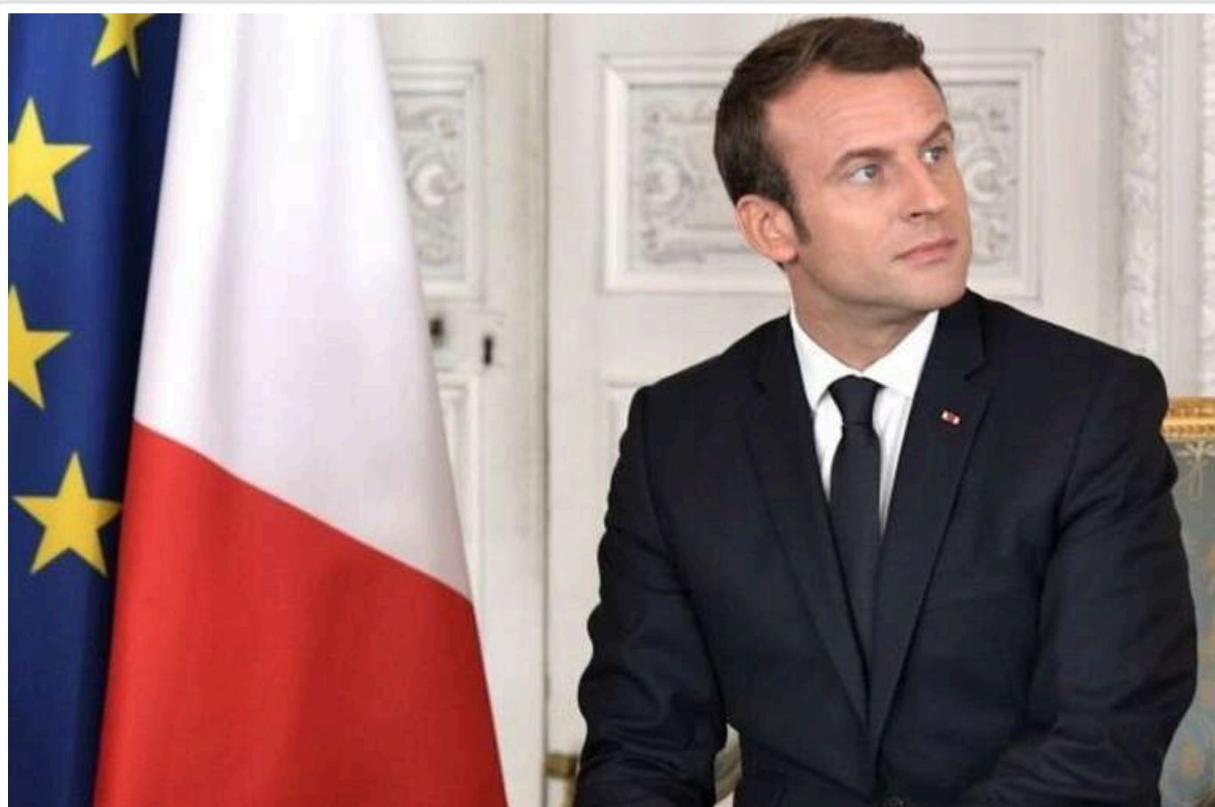
Путін піде на Молдову й Румунію, якщо його не зупинити, - Макрон

Україні та США потрібно налагодити відносини та «зберегти спокій і взаємоповагу».