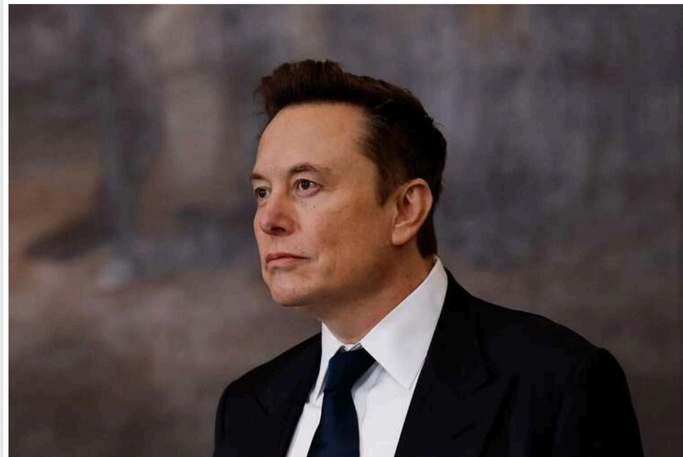
Маск вважає, що США потрібно вийти з НАТО й ООН

Ілон Маск висловив згоду з ідеєю про вихід США з НАТО та ООН.