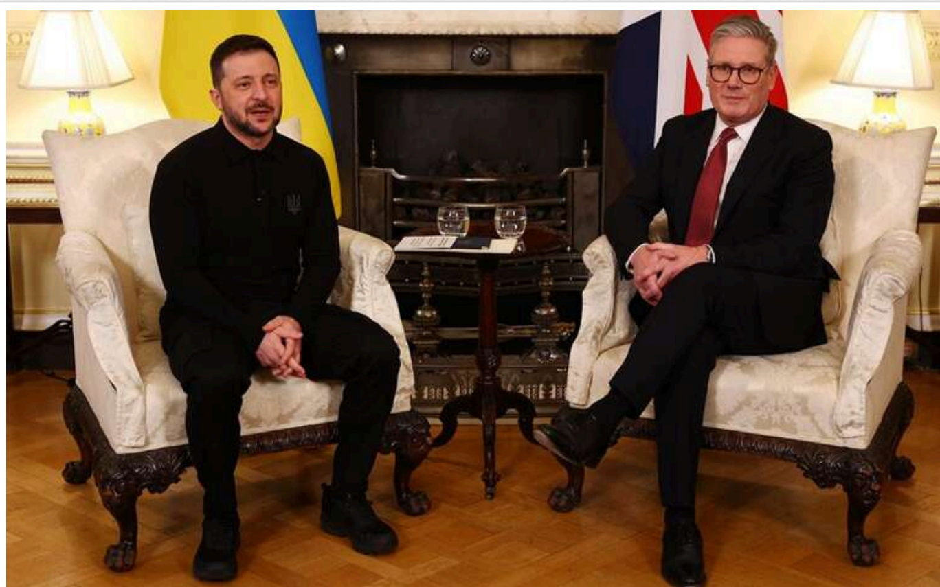
Reuters: Стармер на саміті в Лондоні спробує відродити надію на мир

Прем'єр-міністр Великої Британії Кір Стармер на зустрічі з президентом України Володимиром Зеленським та іншими західними лідерами в неділю спробує відновити надію на завершення російсько-української війни мирною угодою.