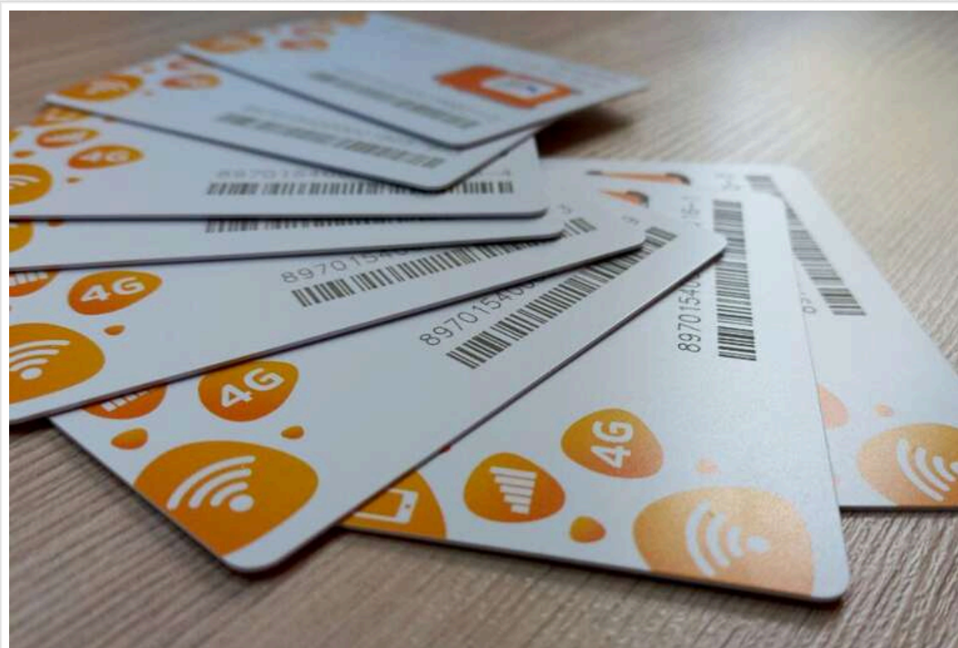
У "ЛНР" "іноземцям" не продають сімки та будуть блокувати телефон тим, хто без паспорта РФ

На окупованій частині Луганщини з 1 липня будуть блокувати мобільні номери тим, хто не оновить особисті дані.