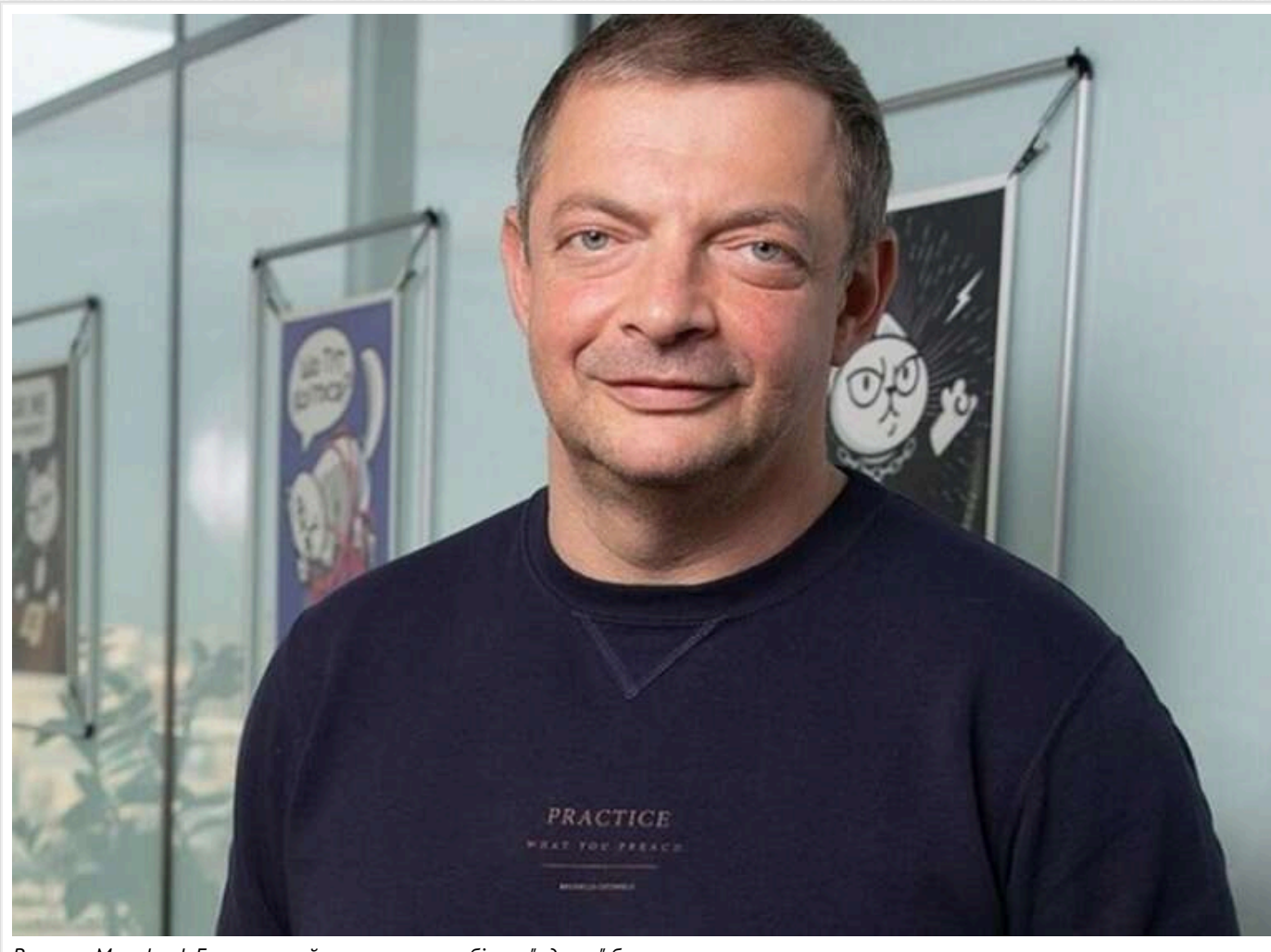
Власник Монобанк Гороховський пояснив, чому збір на "ядерку" був жартом

За словами банкіра, фінансування та створення ядерної зброї потребує "значно більших обсягів коштів", ніж ті, що можна зібрати через Монобанк, а сам процес був би непублічним.