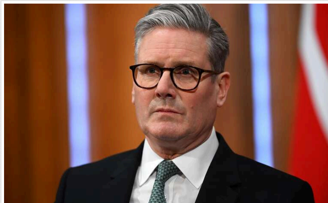
Стармер запевнив Зеленського у "повній підтримці" України

Сполучене Королівство продовжує підтримувати Україну. Країна співпрацюватиме стільки, скільки це буде потрібно.