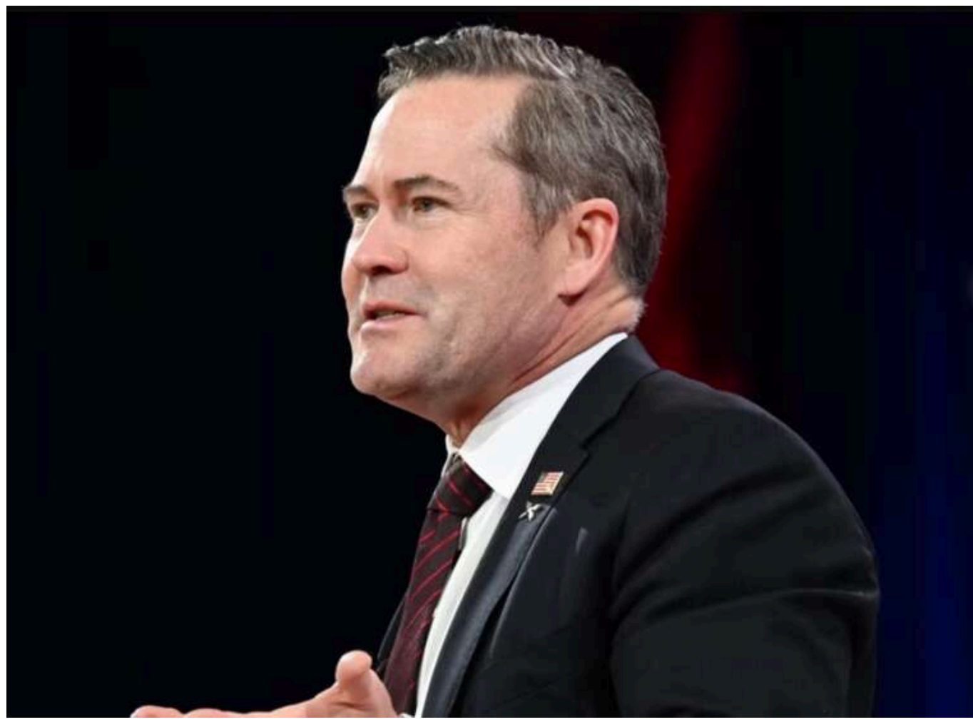
Зеленського попереджали не приїжджати, але він приїхав, рішуче відстоюючи свою позицію, - радник Трампа Майк Волтц

Радник колишнього президента США Дональда Трампа з національної безпеки Майк Волц висловився про візит Володимира Зеленського до Вашингтона, зазначивши, що українського президента попереджали не приїжджати, але він все ж вирішив зробити це, рішуче відстоюючи свою позицію.