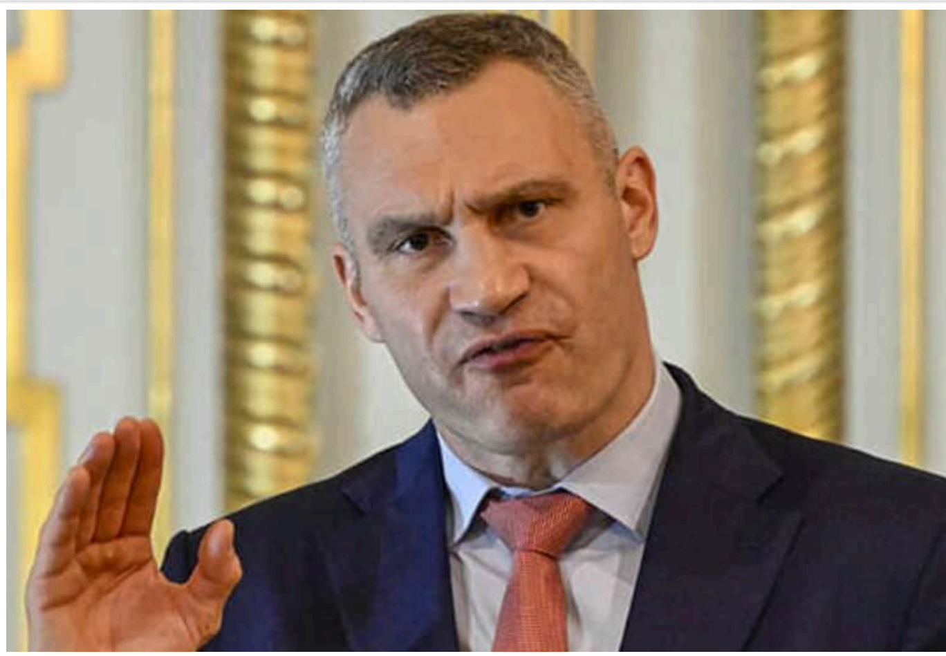
Кличко критикують за "паркетний" пост про підтримку США, вказуючи на недоліки у Київській владі

Міський голова столиці зробив цілком офіційний допис у соцмережах, наголошуючи на важливості збереження підтримки з боку США і зробивши натяк президенту, що це не час для емоцій.