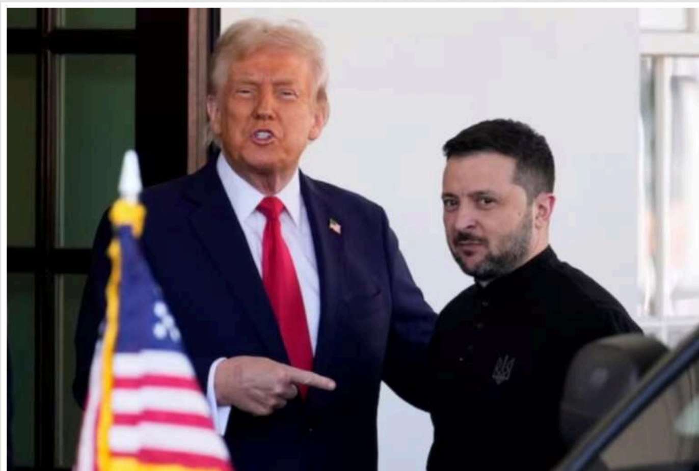
Трампа роздратувало, що Зеленський прибув не в костюмі, - Axios

Одним із чинників, який напередодні роздратував Дональда Трампа під час його зустрічі з Володимиром Зеленським, було те, що президент України прибув на зустріч не в костюмі.