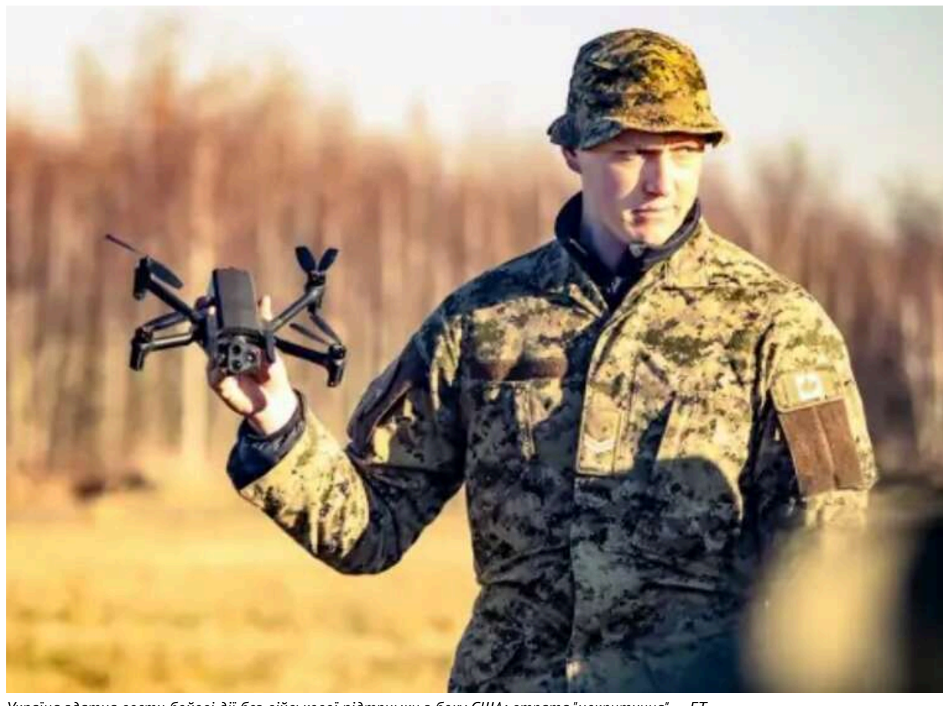
Україна здатна вести бойові дії без військової підтримки з боку США: втрата "некритична", – FT

Військові дії все більше перетворюються на війну роботів і безпілотників. При цьому Україна є лідером у виробництві дронів.