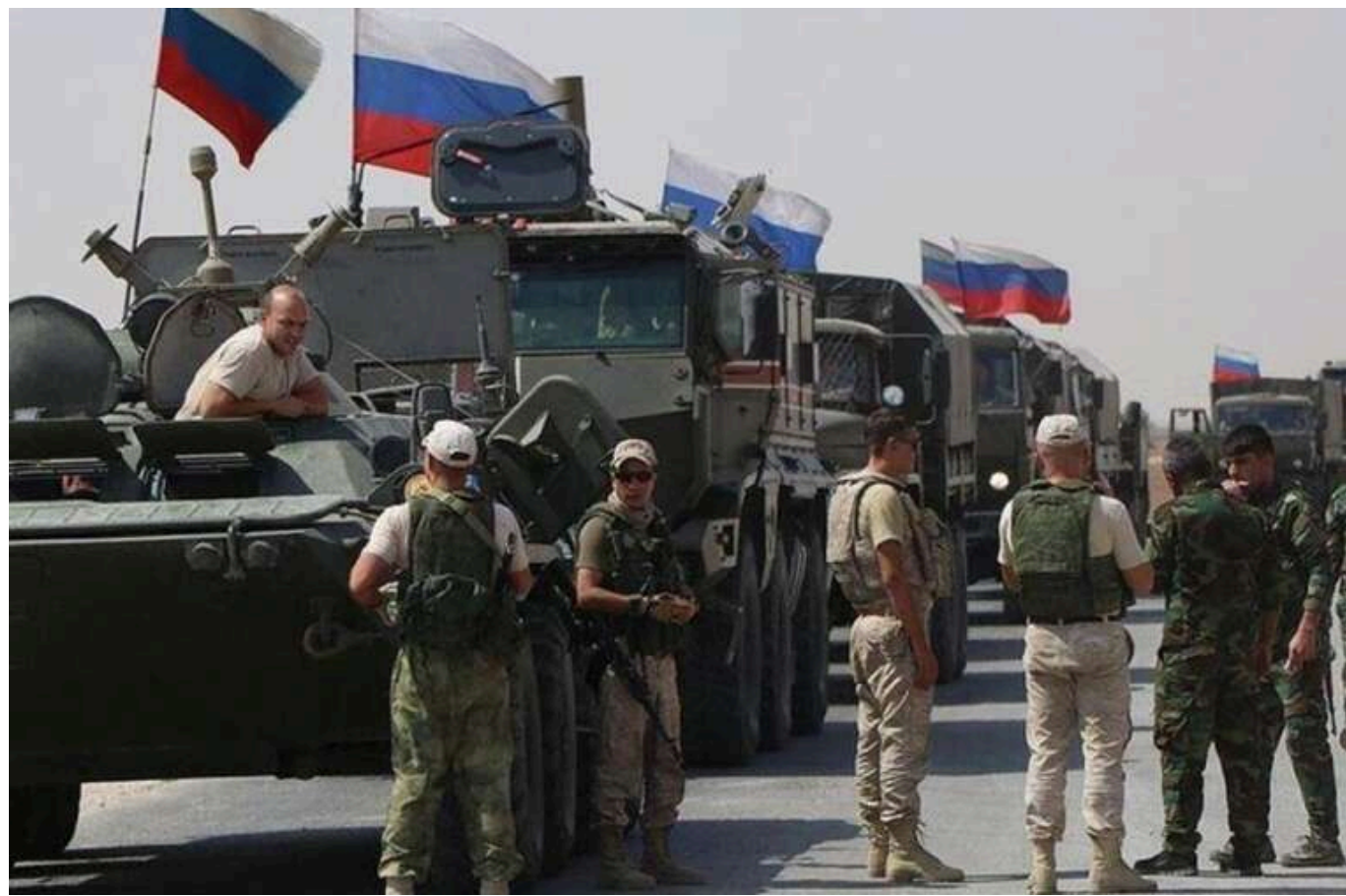
Ізраїль виступає за збереження російських військових баз у Сирії, щоб послабити вплив Туреччини, - Reuters

Ізраїль лобіює в США за збереження російських військових баз у Сирії, включно з військово-морською базою в Тартусі та авіабазою в Хмеймімі.