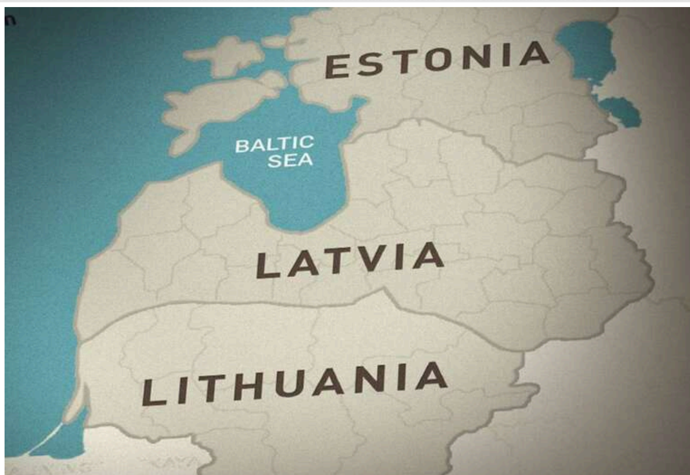
Латвія, Литва і Естонія не будуть присутні на саміті по Україні в Лондоні: "Їх не запросили"

Країни Балтії не запросили на завтрашній саміт європейських лідерів у Лондоні за участю Зеленського і «дуже незадоволені» цим.