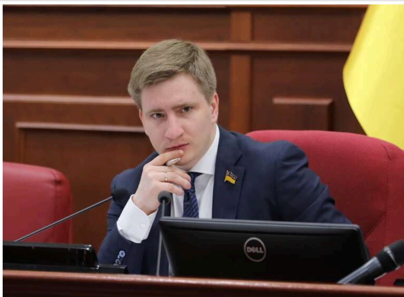
НАБУ оприлюднило записи розмов у "справі Комарницького": у схемах фігурують депутати Київради та високопосадовці

У НАБУ продемонстрували фрагменти з телефонних розмов учасників справи Комарницького, з яких можна зробити кілька висновків: по-перше, записи містять багато фактичних даних; по-друге, у справі можуть бути замішані високопосадовці Києва; і нарешті, це завдасть значного удару по міському голові.