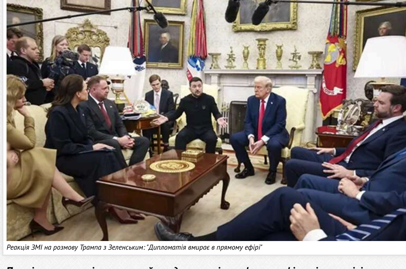
Розмова ЗМІ на розмову Трампа з Зеленським: "Дипломатія вмирає в прямому ефірі"

Перші шпалти світових онлайн-видань рясніють фотографіями із зустрічі президентів США та України — Дональда Трампа та Володимира Зеленського, де між ними спалахнула суперечка за участі також віцепрезидента США Венса. Кореспонденти діляться враженнями, що були шоковані й ще не бачили подібного в Білому домі, а ця словесна суперечка між Трампом і Зеленським — надзвичайна подія у світі дипломатії.