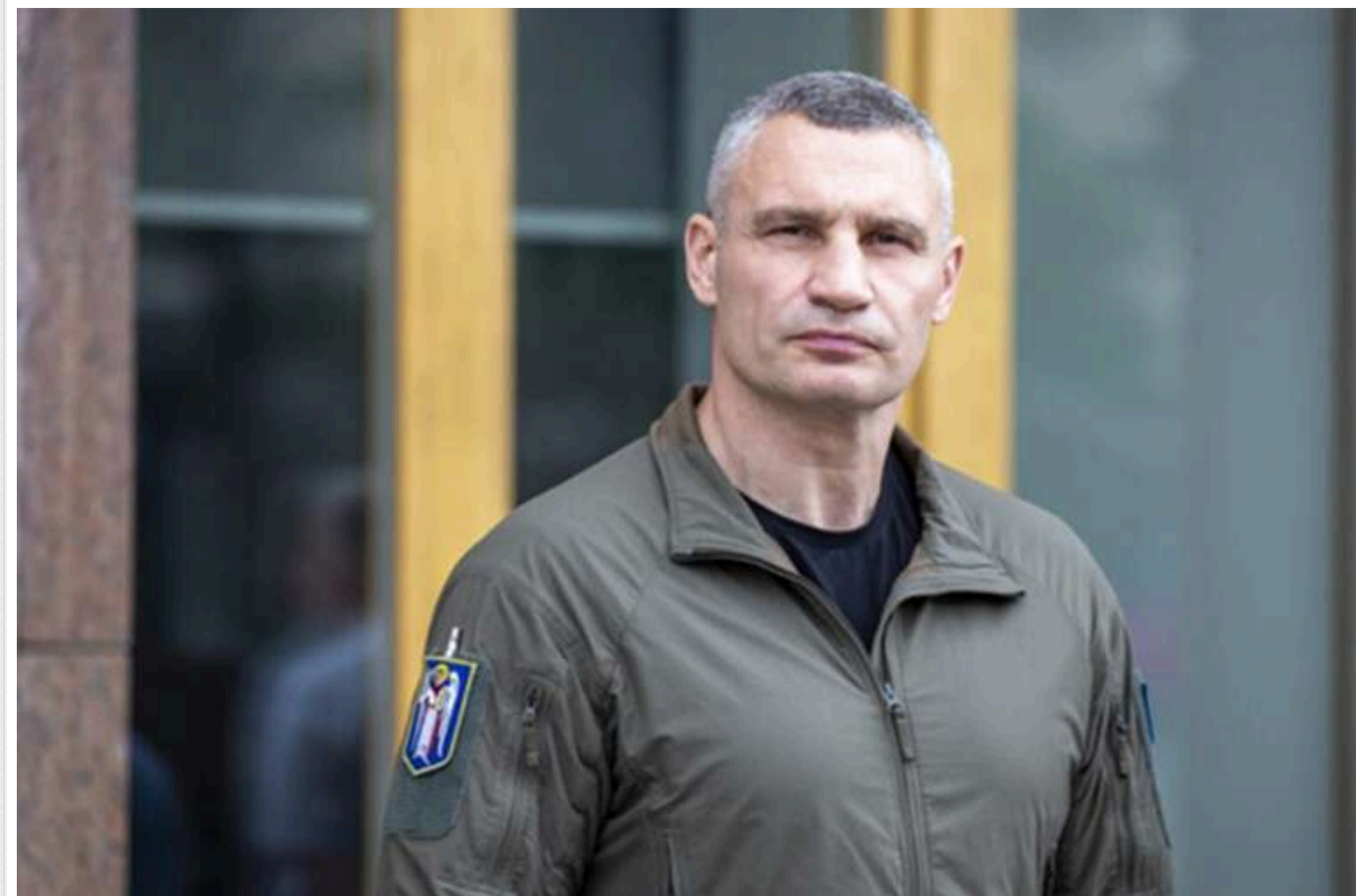
Проти Кличка готують санкції, - журналіст

Проти мера Києва Віталія Кличка можуть запровадити санкції. Попередніми умовами слугують справи НАБУ щодо його близького оточення. Обмеження планують запровадити подібно до тих, які були застосовані проти Петра Порошенка - збиранням інформації про столичного голову займається Фінмоніторинг.