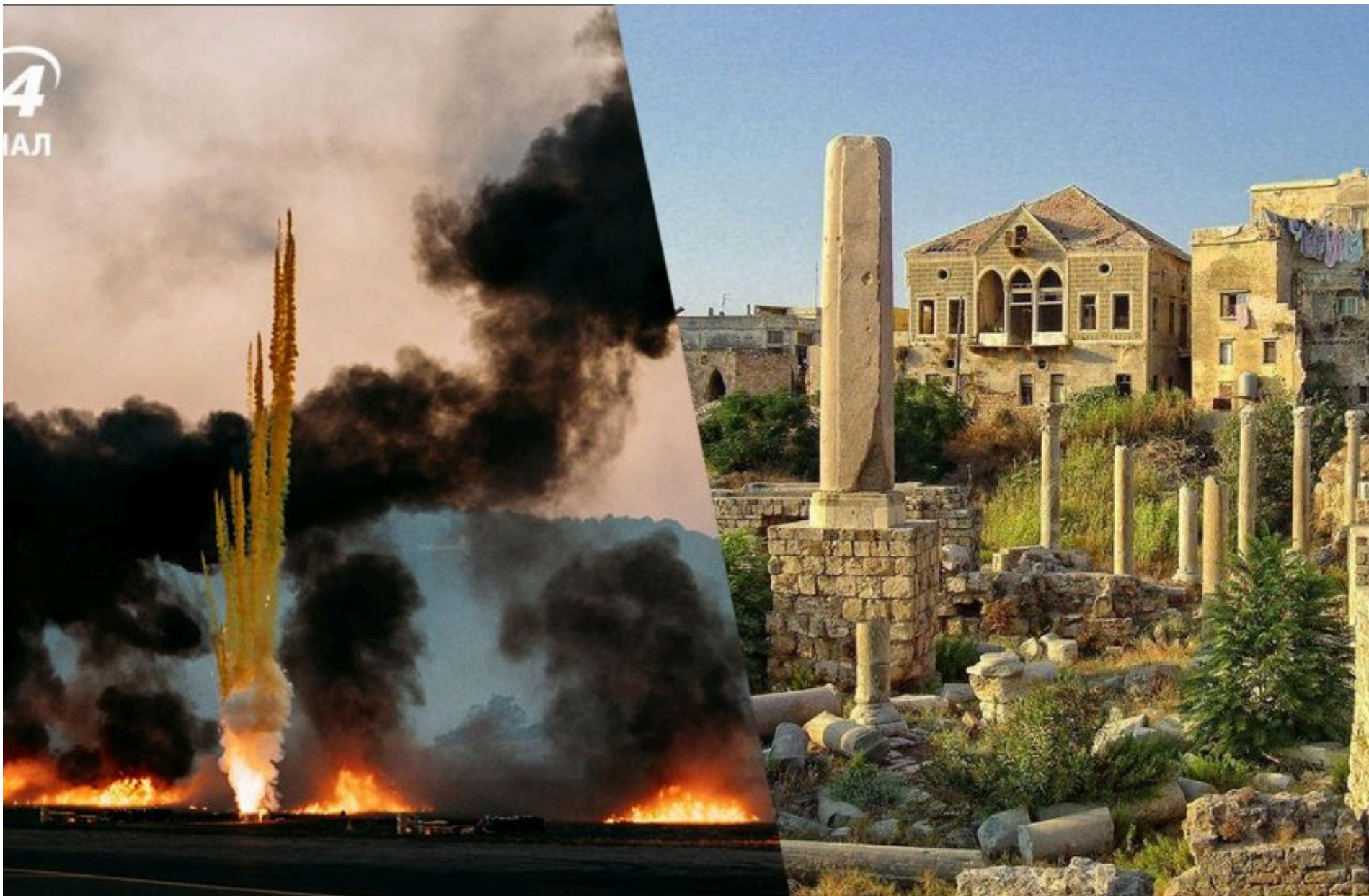
Ізраїль / Фото з відкритих джерел

КАРПЕЦЬ ОЛЕКСАНДР — 02 Червня 2026, 14:47 2 Mins Read — СВІТ