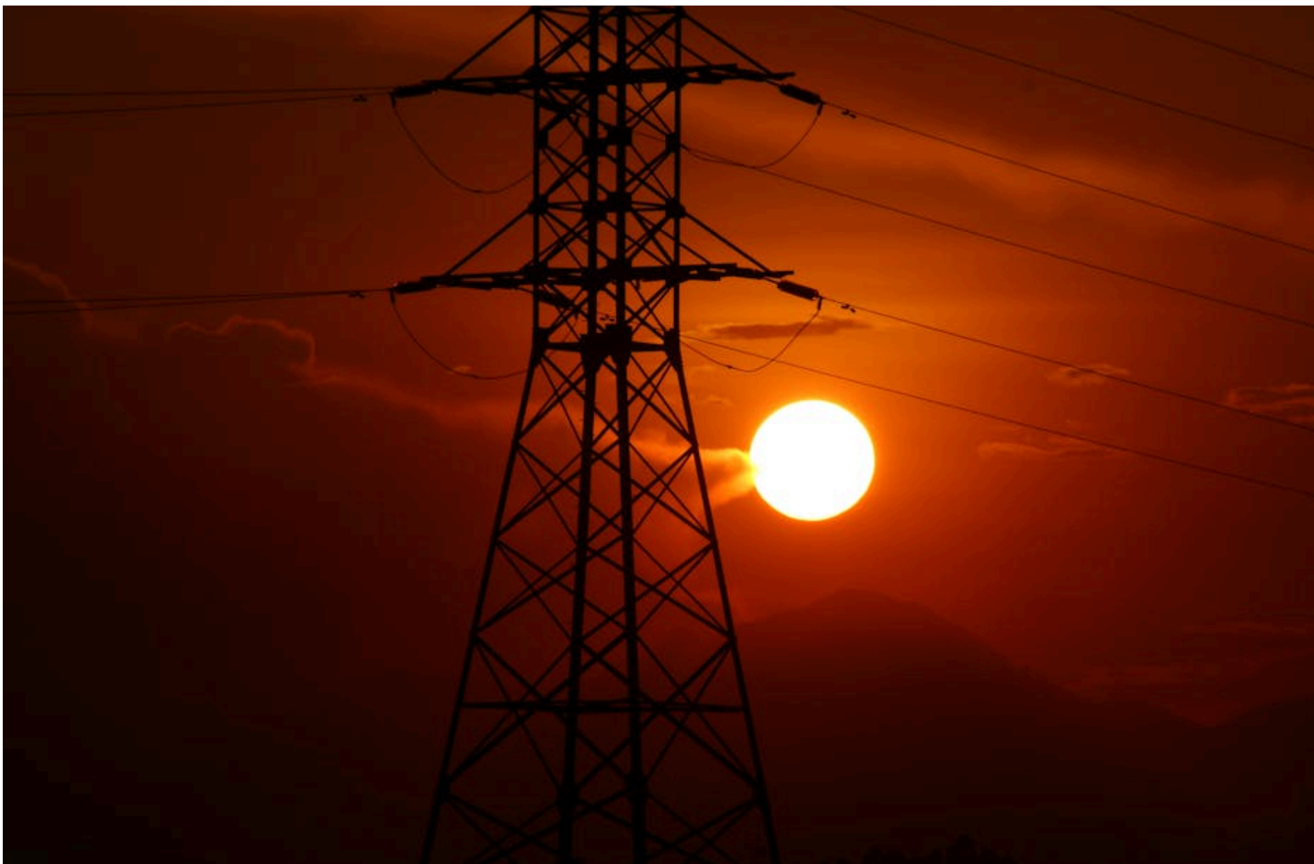
Відключення світла

КАРПЕЦЬ ОЛЕКСАНДР — 02 Червня 2026, 14:54 ⌚ 1 Min Read — УКРАЇНА