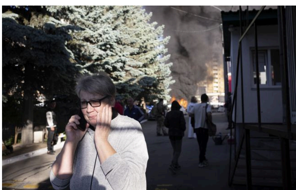
Фото: наслідки удару по Києву 2 червня